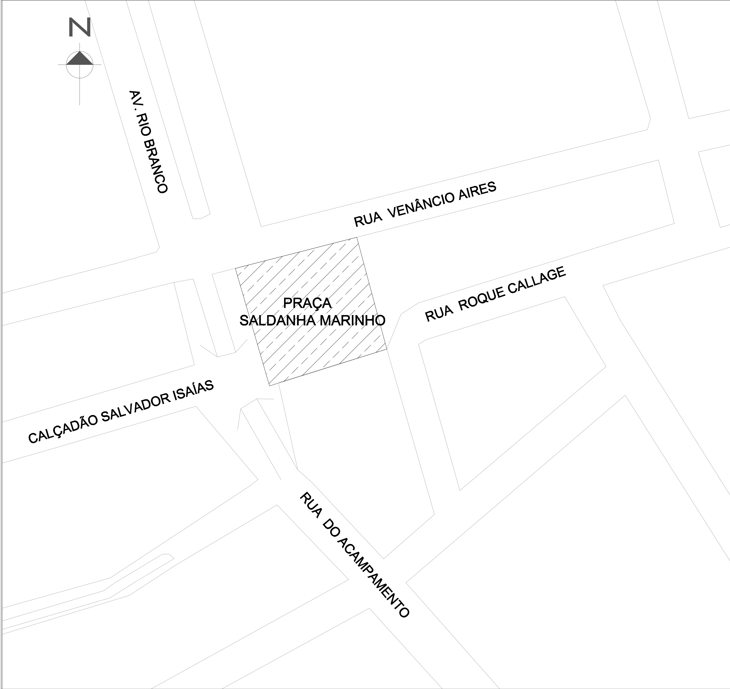
PLANTA SITUAÇÃO Escala 1/500